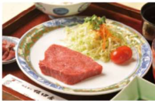
▲飛騨牛をご堪能ください

食事と自由時間が合わせて2時間あります。古い町並みの散策や留守宅へのお土産をご用意ください。