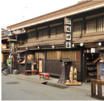
▲風情あふれる「坂口屋」で昼食を